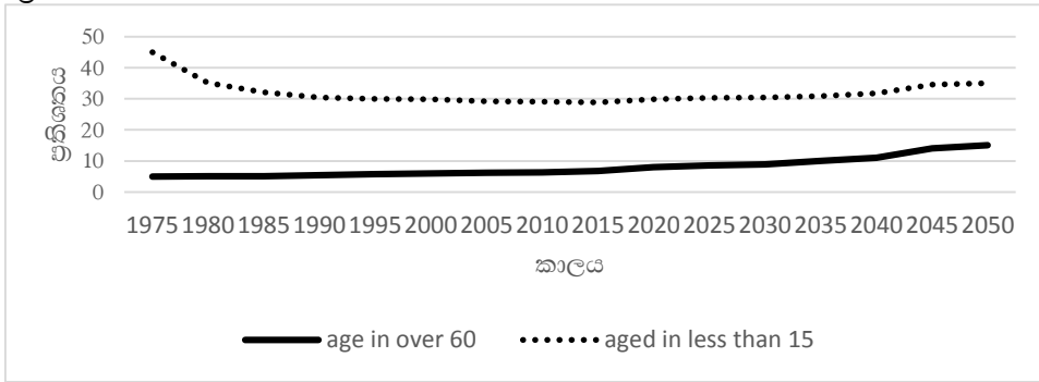
ප්‍රස්ථාරය 1: වර්ෂ 2050 වනවිට වයස්ගත ජනගහනයේ ව්‍යාප්තිය